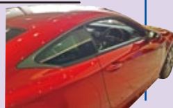
「レクサス」の窓枠に採用されています！

「アベルブラック」というオンリーワン技術でステンレスの黒色材料を国内で製造している。後でプレス加工しても剥がれない皮膜なので、海外に材料を輸出して現地で加工が可能です。