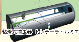
粘着式捕虫器 トレテラ・ルミエ