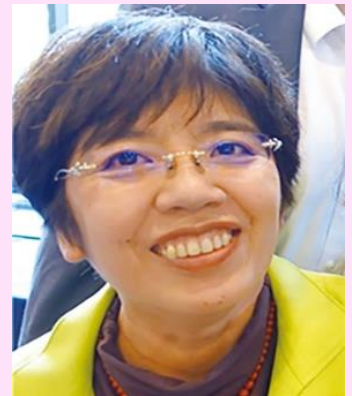
↓海外の方たちとの交流