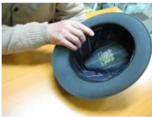
細部まで品質にこだわる