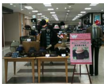
福屋広島駅前店 期間限定売場