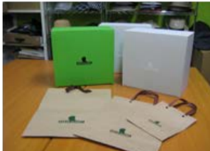
オリジナル箱と紙袋