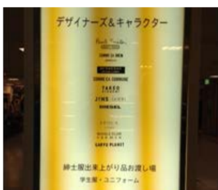
大丸京都店 ブランド売場